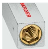
С копирующей автоматикой