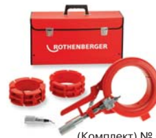
(Комплект) № 5.5063